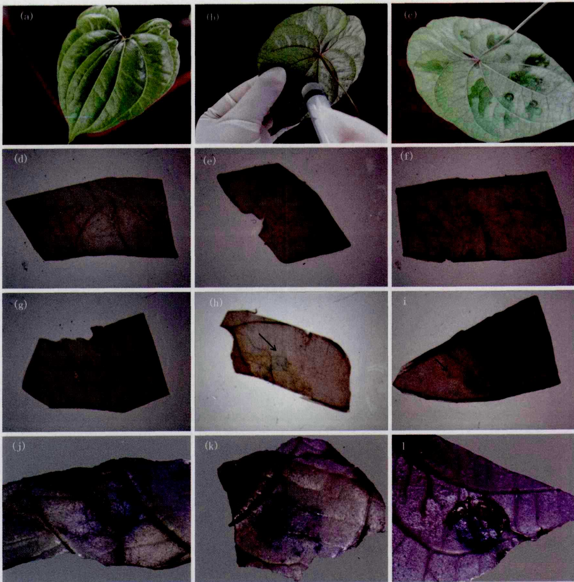
(a)生长良好的叶片; (b)叶片注射; (c)注射后叶片; (d)-(e)未注射叶片培养1 d和5 d的GUS染色结果(对照); (f)-(l):分别为注射后1 d、2 d、3 d、4 d、5 d、6 d和7 d的GUS染色结果。