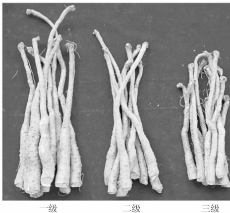
图2 不同等级的怀山药种栽

比较不同等级的种栽在种植 45 d 后出苗率的情况,见图 3。一级种栽的出苗率最高(91%),二级的次之(82%),三级最低(68%),种栽质量等级与出苗率均存在极显著的相关性。