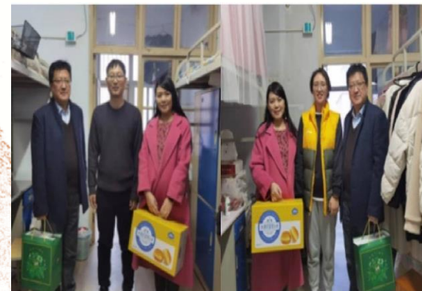
加入国教 关爱满满