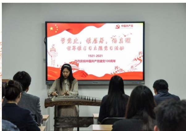
“学党史 读原著 悟真理” 世界读书日主题党日活动