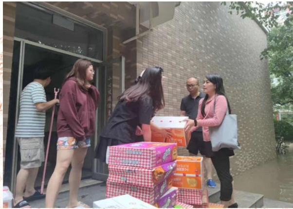
老师送来了生活物资