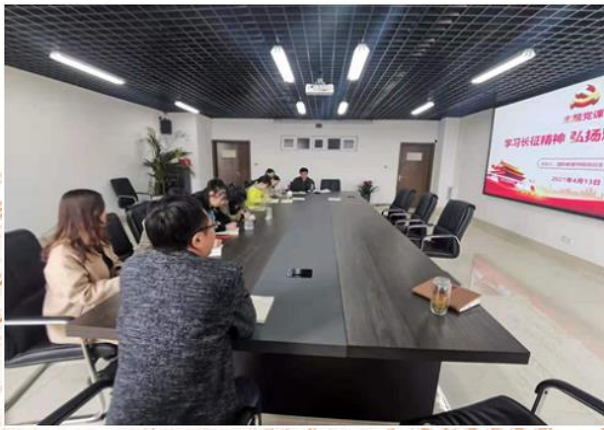
“学习长征精神 弘扬 艰苦奋斗作风”主题党课