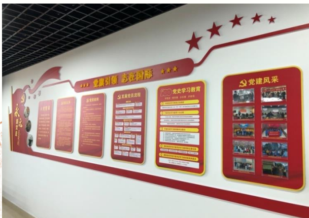
听党话跟党走， 党建文化墙营造浓厚氛围