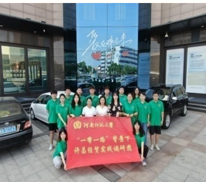
实践出真知 经风雨长才干