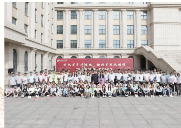
以“牢记百年峥嵘路，强 国有我砥砺前行”为主题的 第五届彩色健跑暨第四届 “国际青年汇”开幕