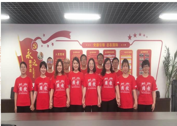
我心国教 汇聚智慧