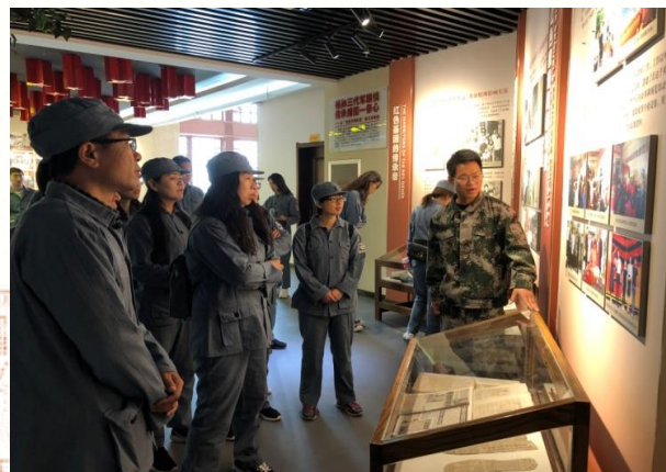
“学习抗战精神，坚定 理想信念”主题党日活动