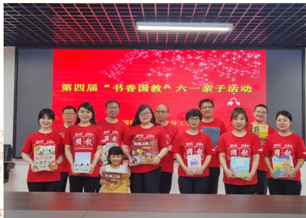
书香国教 真挚祝福