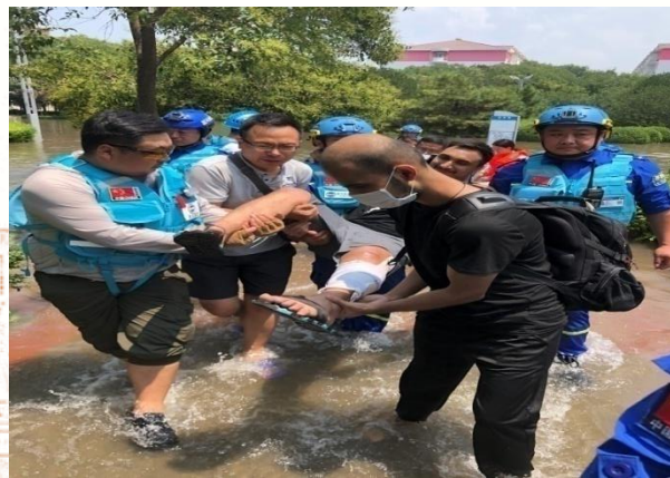
安全转移受困留学生