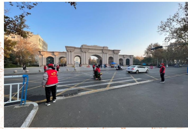
志愿红筑起师大亮丽风景线