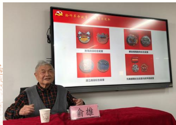
感悟伟大抗美援朝精神 厚植爱党爱国为民情怀