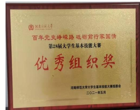
锤炼技能 积极参赛