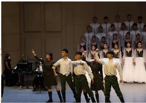
歌曲《远在小河对岸》 精彩亮相中俄高校文艺展演