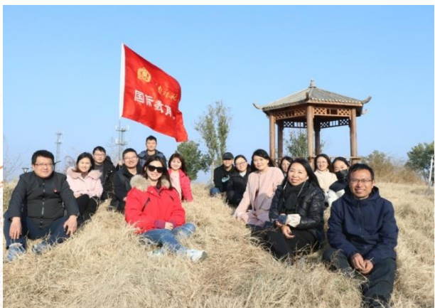
健康国教 陶冶情操