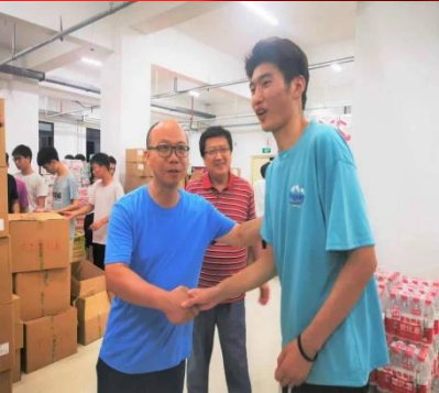
星夜返校 以爱抗洪

全面贯彻党的教育方针，落实立德树人根本任务，擦亮学生工作 特色品牌，培养具有“深厚家国情怀、宽广国际视野、精深专业 技能、广博人文素养、高超创新能力”的一流国际化人才。