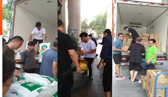
中外友好爱相助 同舟共济克时艰