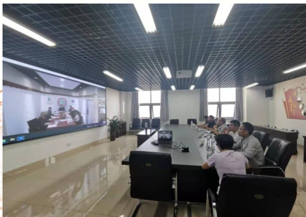
与白俄罗斯国立体育大学 召开教学工作视频会议