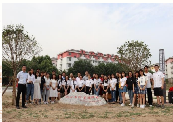
2021届毕业生认捐“校友 林”挂牌暨“感恩石”揭幕