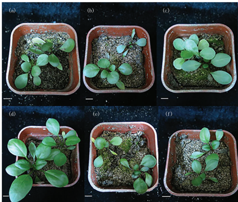
(a) 对照;(b) 辐照 7.50 min;(c) 辐照 15.00 min;(d) 辐照 22.50 min;(e) 辐照 30.00 min;(f) 辐照 37.50 min.