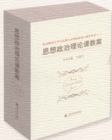
马克思主义理论研究与教学丛书