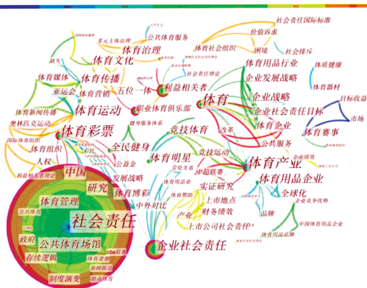
图1 关键词共现网络图谱

利于把握该领域的研究热点与方向。将 CiteSpace 主控界面节点类型设置为 Keyword(关键词),2 年设置为 Years Per Slice(时间切片),绘制出我国体育企业社会责任研究的关键词共现图谱(图 1)和 高频、高中心性关键词列表,共计算出 225 个节点和 330 条连线,每一个节点代表一个关键词,节点越大则出现频次越高,节点之间的连线代表关键词之间联系的紧密程度 [2] 。